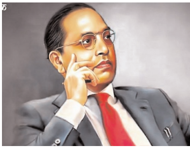
మాట్లాడాల్సిన చోట మానంగా ఉండటం.. మానంగా