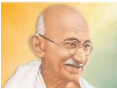
అంత గొప్పగా జీవించావో నీ చేతులు చెప్పాలి.. అంత గొప్పగా మరణించావో ఇతరులు చెప్పాలి - మహాత్మా గాంధీజీ

సారకులకు విజ్ఞప్తి జనస్వరం న్యూస్ తెలుగు వారపత్రిక ద్వారా తక్కువ ఖర్చుతో పుట్టినరోజు శుభాకాంక్షలతో పాటు అన్ని కార్యక్రమాలకు ప్రకటనలకు సంప్రదించండి. మా మెయిల్ బాక్స్ : janaswaramnews@gmail.com మొబైల్ నెంబర్ : 9642067900