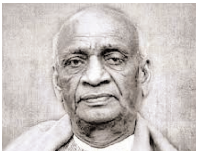
నిజాను నిర్లక్ష్యం చేస్తే అవి రెట్టింపు శక్తితో ప్రతీకారం తీర్చుకుంటాము