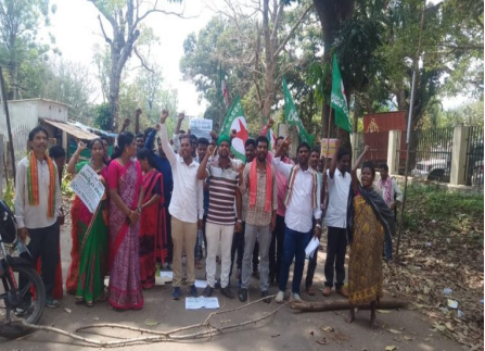
నాయకులు, ఇతర సంస్థల నాయకులు పాల్గొన్నారు.