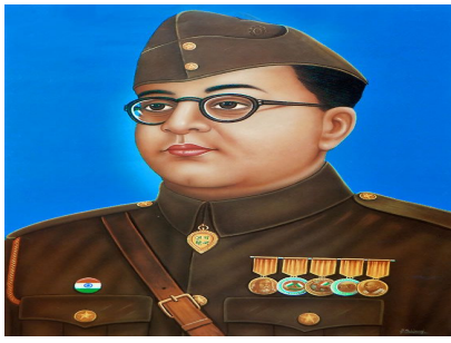
స్వేచ్ఛ ఎవరి నుండి ఇవ్వబడదు, మనకు మనమే తీసుకోవాలి. - సుభాష్ చంద్రబోస్