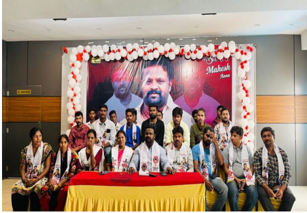
రెడ్డి కృషి చేస్తున్నాడని ఆరోపించారు. ఇప్పటివరకు కూడా ముఖ్యమంత్రి జగన్మోహన్ రెడ్డి తన సొంత లాభం కోసమే ఢిల్లీ పర్యటన చేశారు తప్ప రాష్ట్ర ప్రజల శ్రేయస్సు కోసం కానీ రాష్ట్ర అభివృద్ధి కోసం కానీ, ఢిల్లీ పర్యటనలు

మదనపల్లి ( జనస్వరం ) : మదనపల్లి పట్టణంలోని గొల్లపల్లి జనసేన పార్టీ కార్యాలయంలో ఏర్పాటు చేసిన మీడియా సమావేశంలో ఆయన మాట్లాడుతూ ... ప్రధానమంత్రి నరేంద్ర మోడీ, కేంద్ర మంత్రి అమిత్ షా రులతో కలుస్తూ కేసులకు సంబంధించిన లీఫ్ ల. ద్వారా రిలీఫ్ అవుతున్నారని ఎద్దేవా చేశారు. కేసులు మాఫీ చేసుకునేందుకు ఢిల్లీ పర్యటనలు తప్ప... రాష్ట్రానికి రావలసిన ప్రత్యేక హోదా అడిగిన పాపాన పోలేదని వాపోయారు. విజయవాడ , విశాఖపట్నం మెట్రో రైల్ అడగలేదని , మదనపల్లి ,బెంగళూరు రైల్వే లైన్ అమలు చేయడంలో విఫలమయ్యారని విమర్శలు గుప్పించారు. బిజెపి ప్రభుత్వంతో ప్రత్యక్ష పొత్తు ఉండేది ఒక్క వైసీపీ పార్టీకే అని స్పెషల్ స్టేటస్ పై ప్రతిసారి పవన్ కళ్యాణ్ పై నిందలు వేయడం తగదని హితవు పలికారు. కేంద్ర ప్రభుత్వంతో అన్ని విధాల సఖ్యతతో ఉన్నది ఒక్క ముఖ్యమంత్రి జగన్మోహన్ రెడ్డి ప్రభుత్వమే అని ఇప్పుడు కర్ణాటకలో జరగబోయే ఎన్నికలకు పెద్ద మొత్తంలో డబ్బులు పంపించి బిజెపి ప్రభుత్వాన్ని గెలిపించేందుకు ముఖ్యమంత్రి జగన్ మోహన్