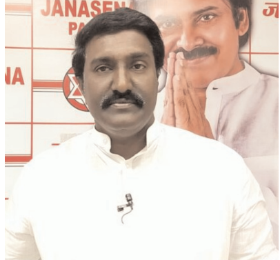
పట్టించారని, ఎమ్మెల్యేలుగా 11 మందికి బీసీలకు పదవులు అంటూ మరొకసారి బీసీలను సామాజిక న్యాయం పేరిట మోసం చేస్తున్నది సీఎం జగన్ అని, శాసనమండలి ఎప్పుడైనా రద్దు అవుతుందని, శాసనమండలి రద్దు చేయాలని అసెంబ్లీలో తీర్మానం చేసి కేంద్ర ప్రభుత్వానికి పంపిన సీఎం జగన్ శాసన మండలిలో ఎమ్మెల్యే స్థానాలను ఏ విధంగా భర్తీ చేస్తారని, రద్దు కాబోయే శాసన మండలిలో బీసీలకు ఇచ్చిన 11 ఎమ్మెల్యే పదవులు తమిళం తో పోయే పదవులు లాంటివి, దీనివల్ల బీసీలకు ఒరిగే ప్రయోజనం ఏమీ లేదని, సామాజిక న్యాయం అంటూ బీసీలను మోసం చేస్తున్న సీఎం జగన్ ముమ్మాటికి బీసీల ద్రోహి అని, స్థానిక సంస్థల ఎన్నికల్లో బీసీలకు 10 శాతం రిజర్వేషన్లు తగ్గించి 16,800 బీసీలు రాజ్యాంగబద్ధంగా పదవులు కోల్పోయేలా చేసిన సీఎం వైయస్ జగన్ ముమ్మాటికి బీసీల ద్రోహి అని, సీఎం జగన్ ప్రభుత్వంలో కుల చేతివృత్తులను ఏనాడైనా అడరించారా? అని పెళ్ళి కానుక పథకంలో అనేక నిబంధనలను చేర్చి బీసీ ఆదవీలలను మోసం చేసిన సీఎం జగన్ ని ఎద్దేవా చేశారు.