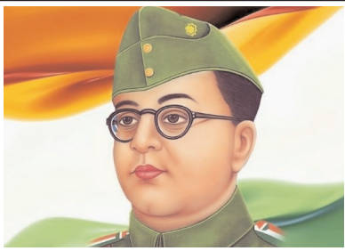
అన్నింటినీ మించిన నేరం అన్యాయంతోనూ,