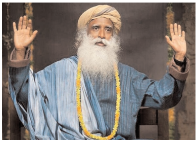
మీరు సంపాదించేది బాగా జీవించడానికే.. అంతేకానీ..

ఒత్తిడితో మిమ్మల్ని మీరు చంపుకోవడానికి కాదు..