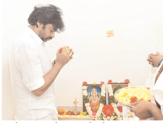
- అక్టోబర్ మాసంలో నిర్వహించే పార్టీ కార్యక్రమాలపై ముఖ్య నిర్ణయాలు

హైదరాబాద్, (జనస్వరం) : శరన్నవ రాత్రి పర్వ దినాల్లో భాగంగా పంచమి తిథిని పురస్కరించుకొని జనసేన పార్టీ కేంద్ర కార్యాలయంలో పార్టీ అధ్యక్షులు పవన్ కళ్యాణ్ సరస్వతి పూజ నిర్వహించారు. శుక్రవారం ప్రభాత సమయాన శాస్త్రోక్తంగా పూజాదికాలు చేపట్టారు. తెల్లవారుజామునే హైద