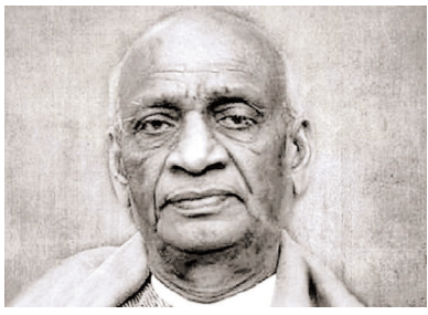
నిజాలను నిర్లక్ష్యం చేస్తే అవి రెట్టింపు