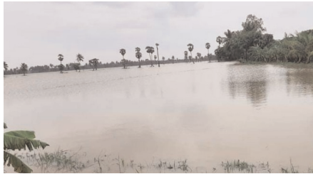
రాయవరం, (జనస్వరం) : రాయవరం మండలం చెల్లూరు గ్రామ పరిధిలో కోరంగి కాలువ ఎడమ గట్టు