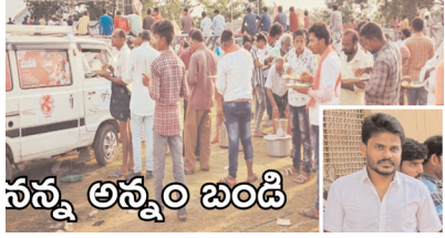
పవనన్న అన్నం బండి

కావలి (జనస్వరం) : కావలి నియోజకవర్గంలో రోజూ నిత్యం వందలాది మందికి "పవనన్న అన్నం బండి" ద్వారా ఆకలిని తీరుస్తున్నారని జనసేన నాయకులు సిద్దా. ఆయన మాట్లాడుతూ రాష్ట్రంలో చాలా మంది పేదవాళ్ళు ఆకలితో అలమటిస్తున్నారని, అలాంటి వారి కోసం జనసేన పార్టీ ద్వారా ఆకలిని తీరుస్తున్నారని, జనసేన అధ్యక్షుడు పవన్ కళ్యాణ్ పేదల ఆకలి తీర్చేందుకు ఆంధ్రుల అన్నపూర్ణమ్మ డొక్కా సీతమ్మ పేరు మీదుగా ఆహార శిబిరాలను ఏర్పాటు చేశారన్నారు. అలాగే జనసేన పార్టీ మ్యూనిసిపాలిటీలో డొక్కా సీతమ్మ పేరు మీదుగా క్యాంటీన్లను ఏర్పాటు చేస్తామని హామీ కూడా ఇచ్చామన్నారు. గత పాఠశాలలు అన్న క్యాంటీన్ పేరు మీదుగా పేదలకు భోజన సౌకర్యాలను కల్పించారని, అయితే ఆ ఆ పథకంలో అక్రమాలు జరిగాయని చెబుతూ వైసీపీ ప్రభుత్వం ఆ పథకాన్ని తీసి