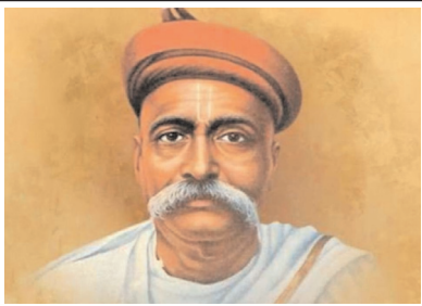
స్వరాజ్యమే నా జన్మ హక్కు.. దాన్ని నేను