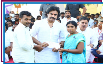
19. దూడేకుల హన్స్విద భీ - బాలదస్మగిరి