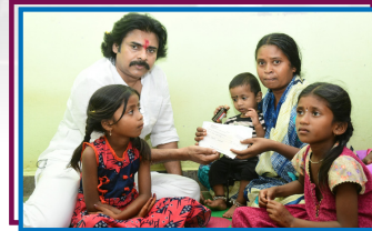
5. శ్రీ మాలింతం చిన్న గంగయ్య - పూలకుంబ