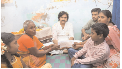
(మొదటి పేజీ తరువాయి)

నోటికొచ్చిన హామీలు ఇచ్చారు. ఇప్పుడు వాటిపై ప్రజల పక్షాన ప్రస్థిస్తుంటే సిటిఎన్ దత్తపుత్రుడు అని అంటున్నారు. మీరు అలా పిలిచినంత మాత్రానా నా ఒంటికి చిల్లులు పడిపోవు. మీరు ఎన్నిసార్లు పిలిచినా ఆది వాస్తవం కాదని ప్రజలకు కూడా తెలుసు. ఇంతకుముందు కూడా నేను చెప్పాను. సేను ప్రజలకు దత్తిపుత్రుడిని తప్పు మరెవరికీ కాదని సీబీఐ దత్తపుత్రుడు అని నేను పిలిచిన మాట వాస్తవం.