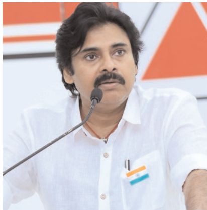
మెడికల్ ఆఫీసర్ వైద్యం చేయాలా? అంబులెన్సులు పురమాయించాలా? ఆసుపత్రి అడ్మినిస్ట్రేషన్ విభాగం పటిష్టం చేయకపోవడం వల్లే ఇలాంటివి జరుగుతున్నాయి. ఈ ఒక్క ఘటనే కాదు -