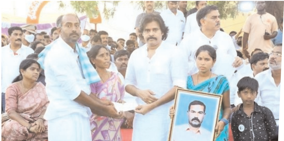
మృతి చెందిన కౌలు రైతు కుటుంబాలకు చెక్కును అందజేస్తున్న దృశ్యం