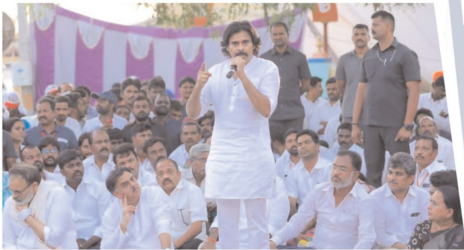
అనంతపురం సభలో ప్రసంగిస్తున్న జనసేన అధినేత పవన్ కల్యాణ్

అనంతపురం, (జనస్వరం) : కష్టాల్లో ఉన్న వ్యక్తుల కన్నీరు తుడవలేనప్పుడు అధికారం ఉన్నా, వేల కోట్లు ఆస్తులు ఉన్నా ఏం ప్రయోజనమని జనసేన పార్టీ అధ్యక్షులు పవన్ కల్యాణ్ ప్రశ్నించారు. అన్నం పెట్టే రైతు కన్నీరు పెడుతుంటే ఎక్కడో ఏసీ భవనాల్లో కూర్చోని బతకలేనన్నారు. రాష్ట్రంలో ఉన్న కౌలు రైతులకు అండగా జనసేన పోరాటం చేస్తుందని, ఆత్మ హత్యలకు పాల్పడ్డ రైతు కుటుంబాలకు రూ. 7 లక్షల నష్టపరిహారం ప్రభుత్వం దగ్గర ముక్కుపిండి వసూలు చేస్తామని స్పష్టం చేశారు. కాలు రైతు భరోసా యాత్రలో భాగంగా అనంతపురం రూరల్ మండలంలోని మన్నీల గ్రామంలో గ్రామసభ నిర్వహించారు. ఆత్మహత్యలకు పాల్పడిన 30 మంది కౌలు రైతు కుటుంబాలకు రూ. లక్ష చొప్పున ఆర్థిక సాయం అందజేశారు. రైతుల ఆత్మహత్యలకు గల కారణాలు, కుటుంబ పరిస్థితులు అడిగి తెలుసుకున్నారు. ఆయన మాట్లాడుతూ “రాజకీయ లబ్ధి కోసం ఈ యాత్ర చేపట్టలేదు. విత్తు నాటడం దగ్గర నుంచి పంట చేతికొచ్చే వరకు రైతు కష్టం తెలిసినవాడిని కాబట్టే ఈ యాత్ర చేపట్టాను. పండించిన పంటలకు గిట్టుబాటు ధరలు లేక, ప్రభుత్వం నుంచి ఆదరణ లేక కౌలు రైతులు చాలా నష్టపోయారు. సాగు కోసం చేసిన