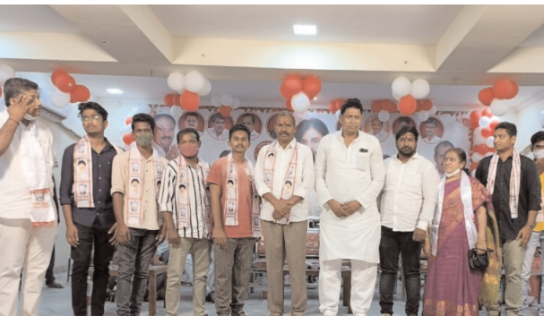
బాపట్ల, (జనస్వరం) : నియోజకవర్గంలో జనసేనపార్టీ కార్యకర్తల ఆత్మీయ సమావేశ కార్యక్రమంలో మండల కమిటీ ఎన్నుకోబడిన వారికి ప్రమాణవ్రతం ఇవ్వటానికి విచ్చేసిన రాష్ట్ర, జిల్లా నాయకులను బైట్ ర్యాలీతో స్వాగతం పలుకుతూ, మూర్తి నగర్లో అంబేద్కర్ విగ్రహానికి పూలమాలలు వేశారు. అలాగే