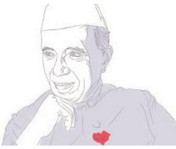
చదువుతో పాటు పెద్దల పట్ల వినయంగా