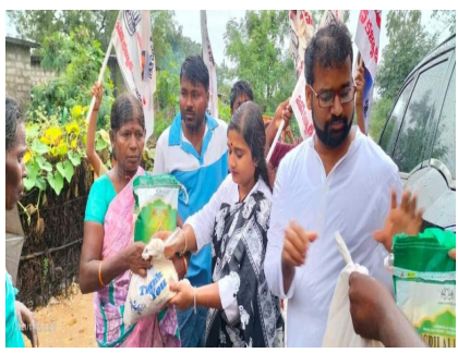
నిత్యావసర సరుకుల పంపిణీ దృశ్యం

శ్రీకాళహస్తి, (జనస్వరం) : జనసేనపార్టీ అధ్యక్షులు పవన్ కళ్యాణ్ ఆదేశాల మేరకు వరద ముంపు ప్రాంతాల్లో సహాయక చర్యల్లో భాగంగా శ్రీకాళహస్తి మండలం, ఏర్రగుడిపాడు కాలనీలో ప్రజలను పరామర్శించి, యూరప్ ఎన్నారై జనసైనికుల సహకారంతో నిత్యావసర వస్తువులు అందజేయడం జరిగింది. ప్రభుత్వం నుండి అందుతున్న సహాయక