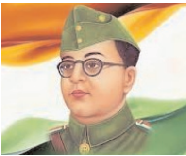
పోరాటం చేయకపోయినా.. లిస్ట్ తీసుకోకపోయినా.. అక్షరమే ఆయుధం - సుభాష్ చంద్రబోస్