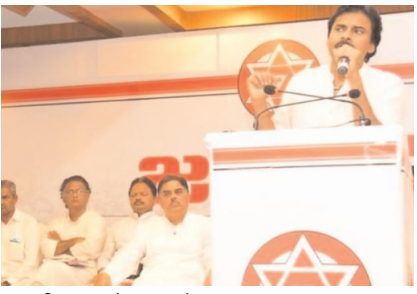
కాదా? అని ప్రశ్నించారు.

- వైసీపీ నాయకులకు ఎవ్వరూ భయపడవద్దు “మనం సమస్యల గురించి మాట్లాడితే వారు వ్యక్తిగత విమర్శలు చేస్తారు. మన దృష్టిని మళ్లించేందుకే వారి ప్రయత్నం అంతా. వారు చేసే పిచ్చి విమర్శలను మనం మంచి భాషను ఉపయోగించి తిప్పికొట్టాలి. ఈ మధ్య మార్కెట్లోకి డెటాల్ పేస్టు, ఫినాయిల్ మౌత్ వాష్ వచ్చింది. పిచ్చి విమర్శలు చేసే వారికి అది పంపితే నోరు కడుక్కుంటారు. వారు వ్యక్తిగతంగా విమర్శలు చేసేది మనకు కోపం తెప్పించడానికే. మనం మాత్రం గీత దాటవద్దు. సహనం కోల్పోవద్దు. వారిని ఆ గీతలోకి తీసుకురండి. అర్జునుడి చందంగా మనం లక్ష్యాన్ని గురిపెట్టాలి. మన లక్ష్యం ఒక్కటే వారి దోపిడిని అరికట్టడం. జనసేనికులు ఎవ్వరూ వైసీపీ నాయకులకు భయపడవద్దు. మన సమాహ బలం ముందు వారి గూండాల బలం పెద్దది ఏం కాదు. మనం ఒక్కసారి తిరిగి చూస్తే వారు కాలిపోతారు” అని అన్నారు. - దేగకన్నుతో ప్రజల ఆస్తులు కాపాడాలి “ప్రజాస్వామ్యంలో దోపిడిని అరికట్టాలంటే ప్రతి నిమిషం దేగ కన్నుతో పహారా కాయాలి. ప్రజా స్వామ్యంలో స్వేచ్ఛ ఉంటుంది కాబట్టి ఆదమరిస్తే ఎక్కువ తినేస్తారు. ప్రజల ఆస్తులు దోచుకోకుండా మనం నిరంతరం దేగ కన్ను వేయాలి. ఒక్క పిలుపుతో స్టీల్ ప్లాంట్ పరిరక్షణ కోసం లక్షన్నర మంది వచ్చారు. మీలో వార్డు నుంచి దేశాన్ని శాసించే నాయకులు ఉన్నారు. స్టీల్ ప్లాంట్ ను ఎవరు వచ్చి తీసుకు