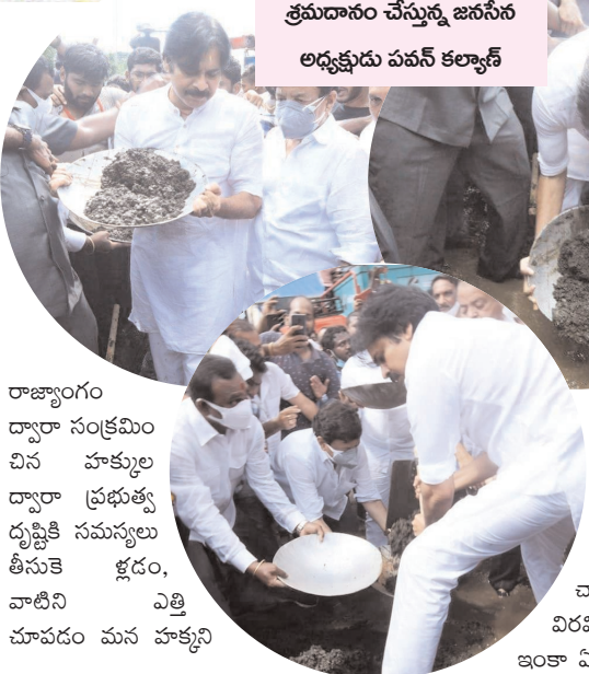
శ్రమదానం చేస్తున్న జనసేన అధ్యక్షుడు పవన్ కల్యాణ్

రాజమహేంద్రవరం/అనంతపురం, (జనస్వరం) : ఇక నా సహనాన్ని పరీక్షించొద్దు.. వైసీపీ.. యుద్ధానికి సిద్ధమవు.. ఏ సైబులో కావాలి ఎంచుకోండి. ఆల్ ది బెస్ట్ అని జనసేన అధ్యక్షుడు పవన్ కల్యాణ్ హెచ్చరించారు. వైసీపీ పాలన దారుణంగా ఉందన్నారు. హక్కుల గురించి మాట్లాడనివ్వడం లేదని... అన్యాయమని ఎవరైనా ప్రశ్నిస్తే జైలుకు పంపుతున్నారని ధ్వజమెత్తారు. దళితుల మీదే ఎస్సీ, ఎస్టీ అట్రాసిటీ కేసులు పెడుతున్నారని దుయ్యబట్టారు. శనివారం తూర్పుగోదావరి జిల్లా రాజమహేంద్రవరంలో రోడ్లపై శ్రమదానం చేశారు. సభలో ఆయన ప్రసంగించారు. తర్వాత అనంతపురం జిల్లా కొత్త చెరువు సమీపంలోని నాగలమడక క్రాసులో రోడ్లపై పడిన గుంతను పూడ్చి, శ్రమదానం చేశారు. ఆ రెండు చోట్లా జరిగిన బహిరంగ సభల్లో ప్రసంగించారు. పేనుకు పెత్తనం ఇస్తే రాత్రంతా కుళ్లబొడిచినట్లుగా.. వైసీపీ కూడా అందరినీ కుళ్లబొడిస్తోందని అన్నారు. ప్రజాస్వామ్యంలో పనులు జరగనప్పుడు, విధానపరమైన తప్పిదాలు జరిగినప్పుడు