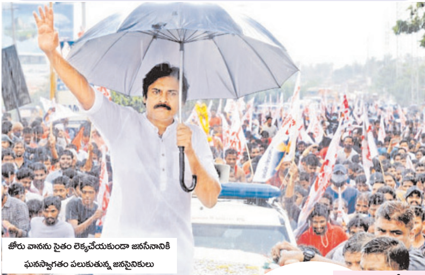
జీరు వానసు సైతం లెక్కచేయకుండా జనసేనానికి ఘనస్వాగతం పలుకుతున్న జనసైనికులు

భవశేషం వస్తున్నామంటే రాత్రికి రాత్రి రోడ్లు వేస్తారు. పుట్టపర్తికి మేం వస్తున్నామంటే రాత్రికి రాత్రి రోడ్లు వేస్తారు. అంటే డబ్బులు ఉన్నాయి మీ దగ్గర. భయపెట్టేవాళ్లే లేరు. మిమ్మల్ని ప్రశ్నించేవాళ్లే లేరు. ప్రశ్నించాలని నేను మిమ్మల్ని ఎందుకు మొత్తుకుంటున్నానంటే.. ప్రశ్నించేవాడంటే అధికారంలో ఉన్నవారికి భయం. జనసేన అంటే వైసీపీ గజగజా వణికిపోతోంది. వచ్చే ఎన్నికల్లో జనసేన విజయపతాకం ఎగరవేయబోతోంది.