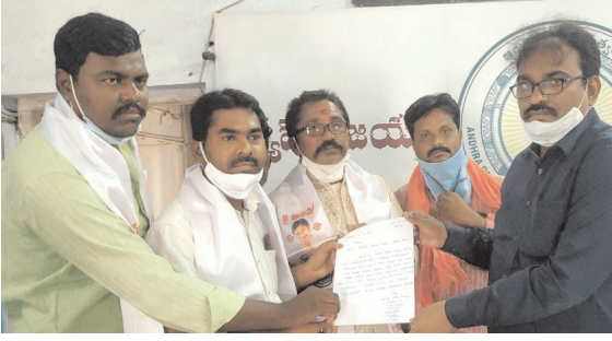
ఆళ్లగడ్డ జనసేన నాయకులు డిమాండ్