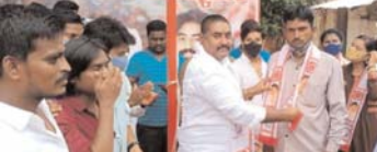
ఎటువంటి మౌలిక సదుపాయాలు కల్పించలేద