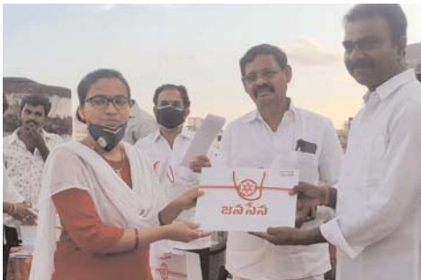
మైలవరం, (జనస్వరం) : మైలవరం నియోజకవర్గం జనసేన పార్టీలో క్రియాశీలక సభ్యత్వం వున్న కార్యకర్తలకు పార్టీ అండగా ఉండాలని దురదృష్టకరంగా ఎవరికి అయినా ప్రమాదం జరిగి ప్రాణాలు పోయిన