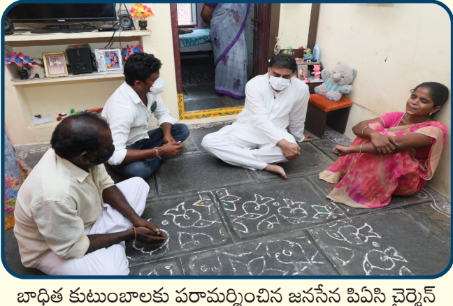
బాధిత కుటుంబాలకు పరామర్శించిన జనసేన పీవీసీ చైర్మన్