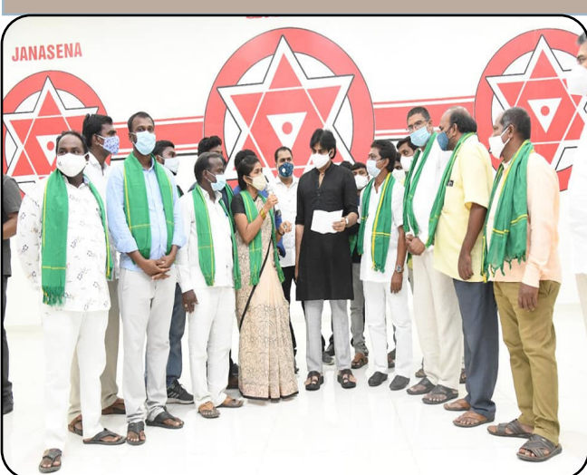
అమరావతి రైతులతో మాట్లాడుతున్న జనసేనాని

న్యూస్ ( జనస్వరం ) : తన ఇంటి పరిసరాల్లో ఉన్న 320 కుటుంబాలకు న్యాయం చేయలేని ముఖ్యమంత్రి రాష్ట్ర ప్రజలకు ఏం న్యాయం చేస్తారని జనసేన పార్టీ అధ్యక్షులు శ్రీ పవన్ కళ్యాణ్ గారు ప్రశ్నించారు. మహిళలు అని కూడా చూడకుండా ప్రజా ప్రతినిధులే పచ్చి బూతులు తిడుతుంటే రాష్ట్రంలో మానభంగాలు జరక్క ఇంకేం జరుగుతాయని అన్నారు. మంగళగిరిలోని జనసేన పార్టీ ప్రధాన కార్యాలయంలో బాధిత నిర్వాసితులు శ్రీ పవన్ కళ్యాణ్ గారిని కలిశారు.