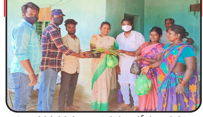
నిత్యావసర సరుకులు అందిస్తున్న జనసేన నాయకులు