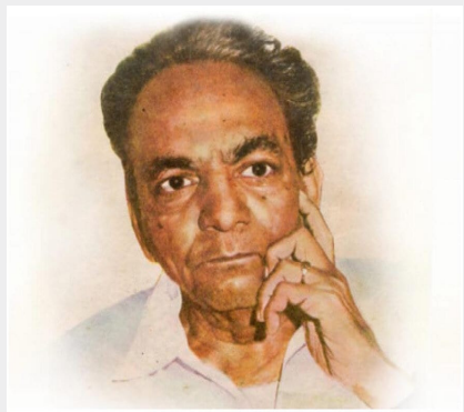
ఏదైనా తనంతట తాను దరి చేరదు. ప్రయత్న పూర్వకంగా సాధిస్తేనే విజయం సొంతమవుతుంది. - శ్రీరంగం శ్రీనివాసరావు