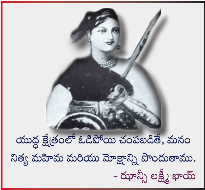
యుద్ధ క్షేత్రంలో ఓడిపోయి చంపబడితే, మనం నిత్య మహిమ మరియు మోక్షాన్ని పొందుతాము. - రూస్సీ లక్ష్మీ భాయ్