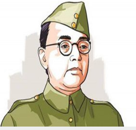
ఒక వ్యక్తి ఒక ఆలోచన కోసం చనిపోవచ్చు, కానీ, ఆ ఆలోచన తన మరణం తర్వాత, వెయ్యి మంది జీవితాల్లో అవతరిస్తుంది. - సుభాష్ చంద్రబోస్